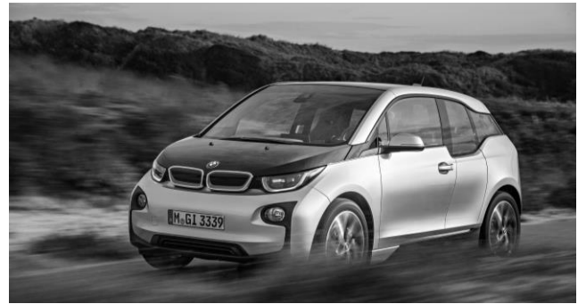
BMW i3 - Anwendungsbeispiel Karbonfaser in der Automobilindustrie

Die individuellen Reise-, Unterbringungs- und Verpflegungskosten liegen beim Teilnehmer.