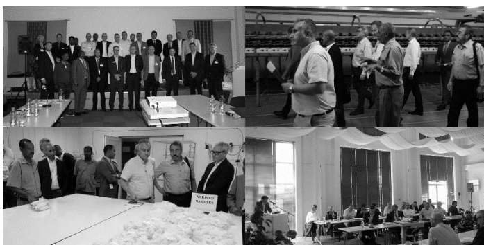
Eindrücke vergangener BMWi-Markterschließungsprojekte aus dem Jahr 2014 im Bereich Maschinen- und Anlagenbau