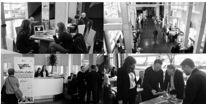
BMWi-Geschäftsanhaltung Italien 2014 in Rom, Mailand und Rovereto im Fachbereich der Gesundheits- und Pflegewirtschaft